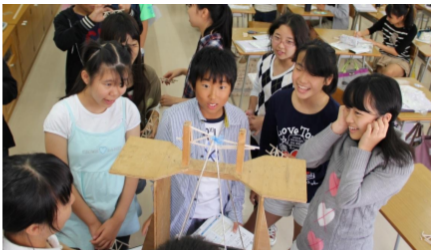
ブリッジコンテスト授業風景'13 (写真は本製品ではありません)