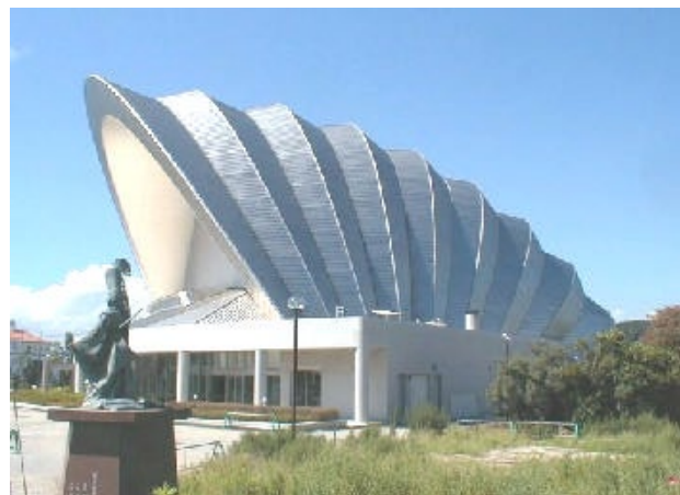
しずかホール（淡路）