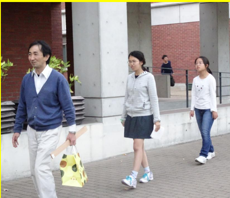
＜伊能忠敬と同じように地球を歩いて計測＞